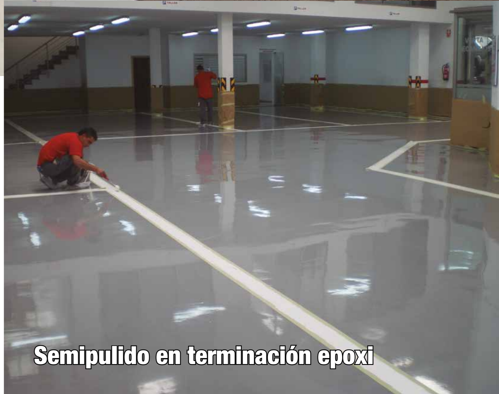
Semipulido en terminación epoxi