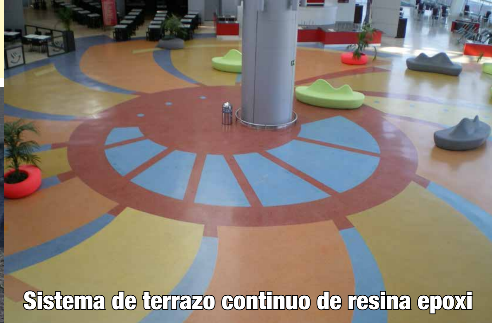
Sistema de terrazo continuo de resina epoxi