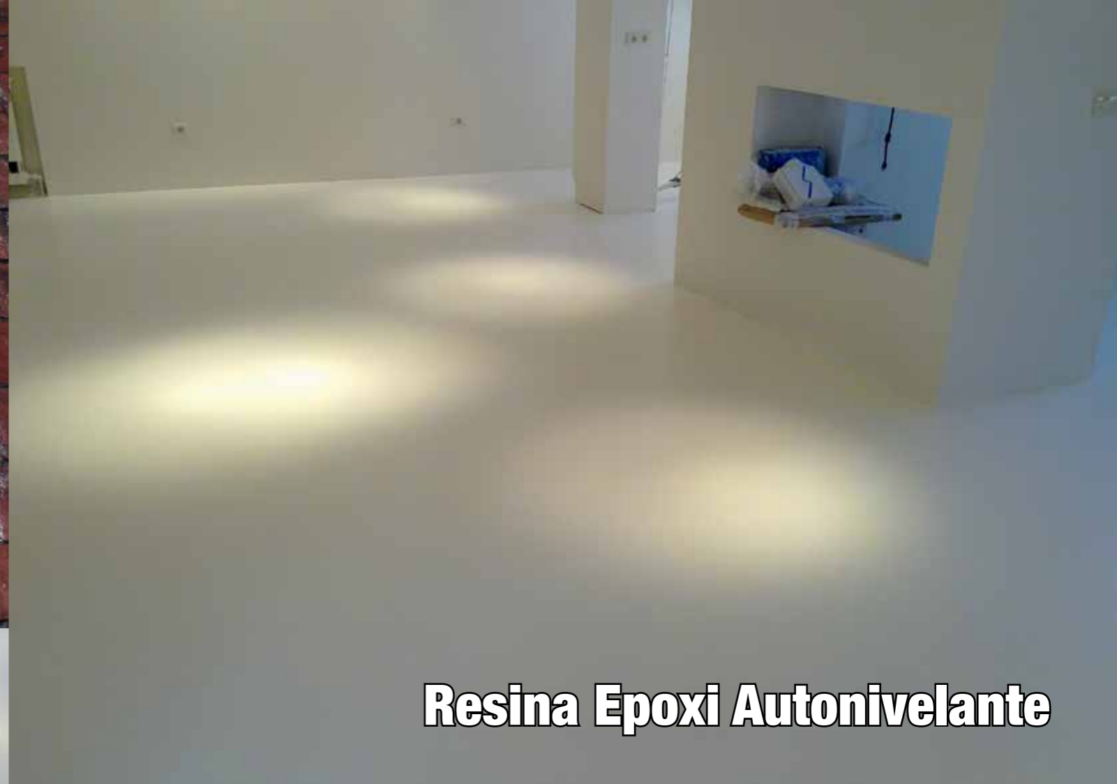
Resina Epoxi Autonivelante