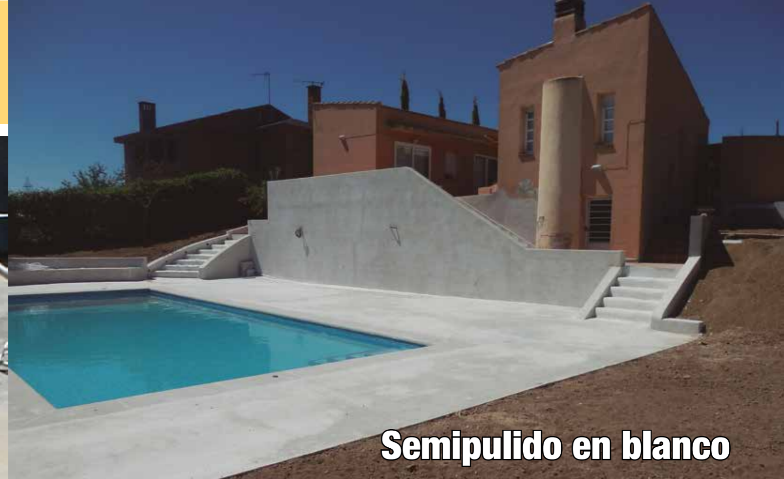
Semipulido en blanco